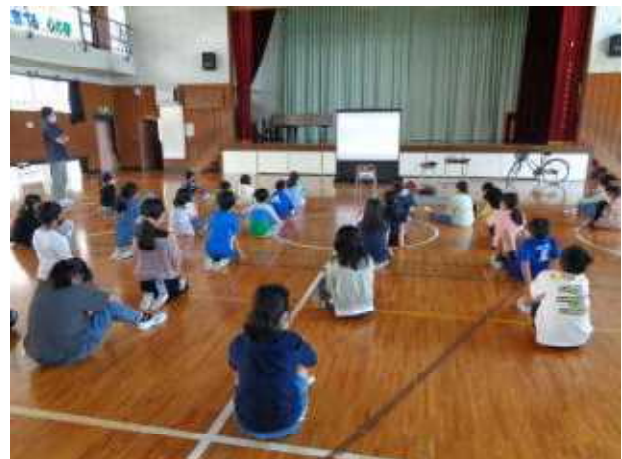
【交通事故の怖さをあらためて確認】