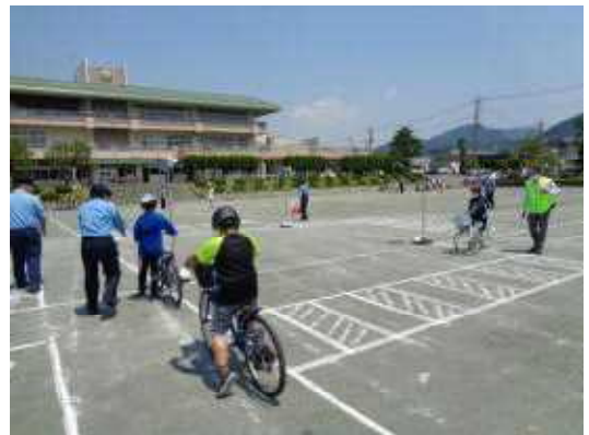
【停止線で一度止まります】

また、3，5年生は体育館でDVDを視聴して、4，6年生は、校庭に線を引いて作った模擬道路上を実際に自転車に乗って、交通ルールや自転車の安全な乗り方を学びました。どの学年の児童も、「命を守るための勉強」であることをきちんと理解し、しっかりと学ぶことができました。