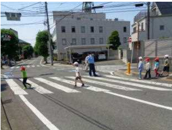
【点滅が始まったら渡りません】