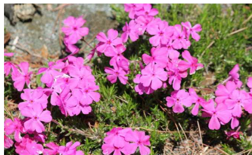
芝桜もきれいです