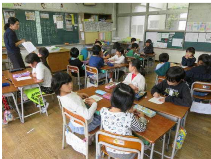
2年 「黄色いベンチ」 みんなのものを大切に

11月1日は、桐生市教委による学校訪問でした。6名の教諭が道徳の授業を公開し、参観し合い、研究討議し、指導主事から講評をいただきました。11月30日には、東部地区全小中学校の人権教育主任等が集まり、「地区別人権教育研究協議会」が開催されます。ここでは、各学年1学級が「道徳」の授業を公開します。人権教育と関わり、児童一人ひとりの思いや考えを大切にし、お互いの意見を認め合える授業となるよう、研究会での議論を踏まえ、準備を進めています。なお、30日は、変則的な時間割(下記を参照)となります。ご理解のうえ、ご協力をお願いいたします。