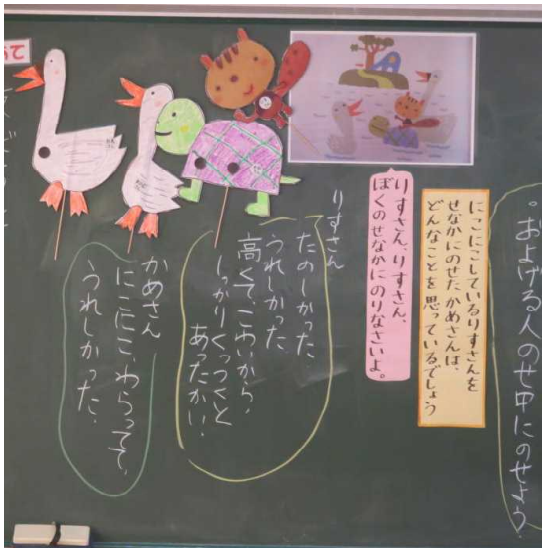
2年「およげないリスさん」ともだちとなかよく