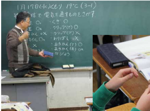
理科 3の1 ↑ → 電気を通す物・通さない物