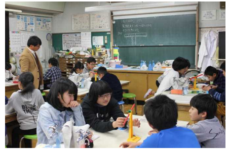
理科 6の1 → てこのはたらき